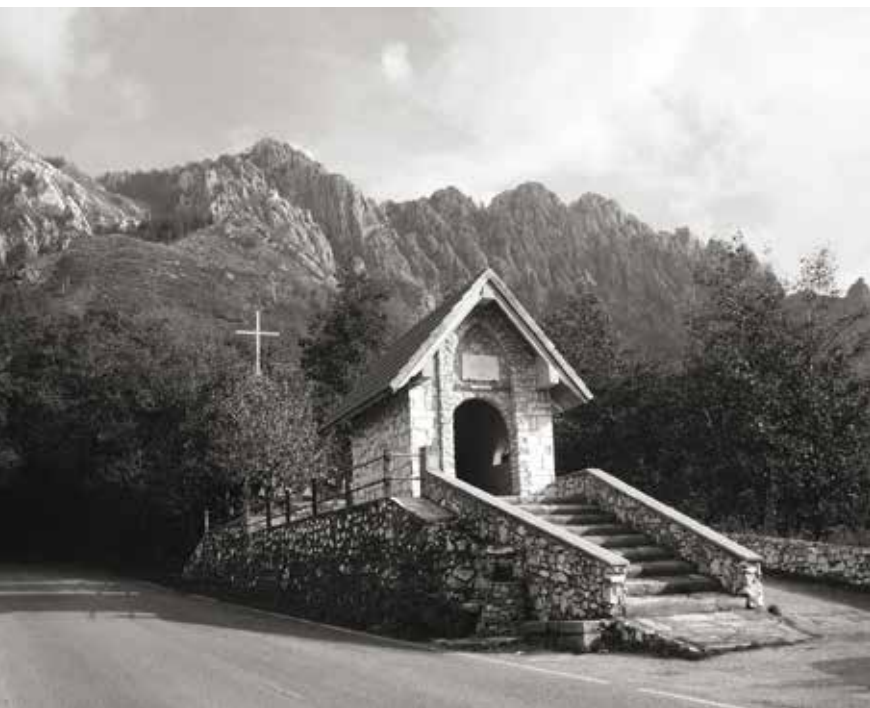
Pian della Fioba