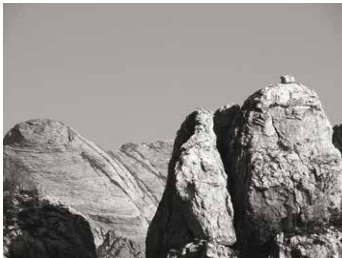
Monte Cavallo e Torrione Figari