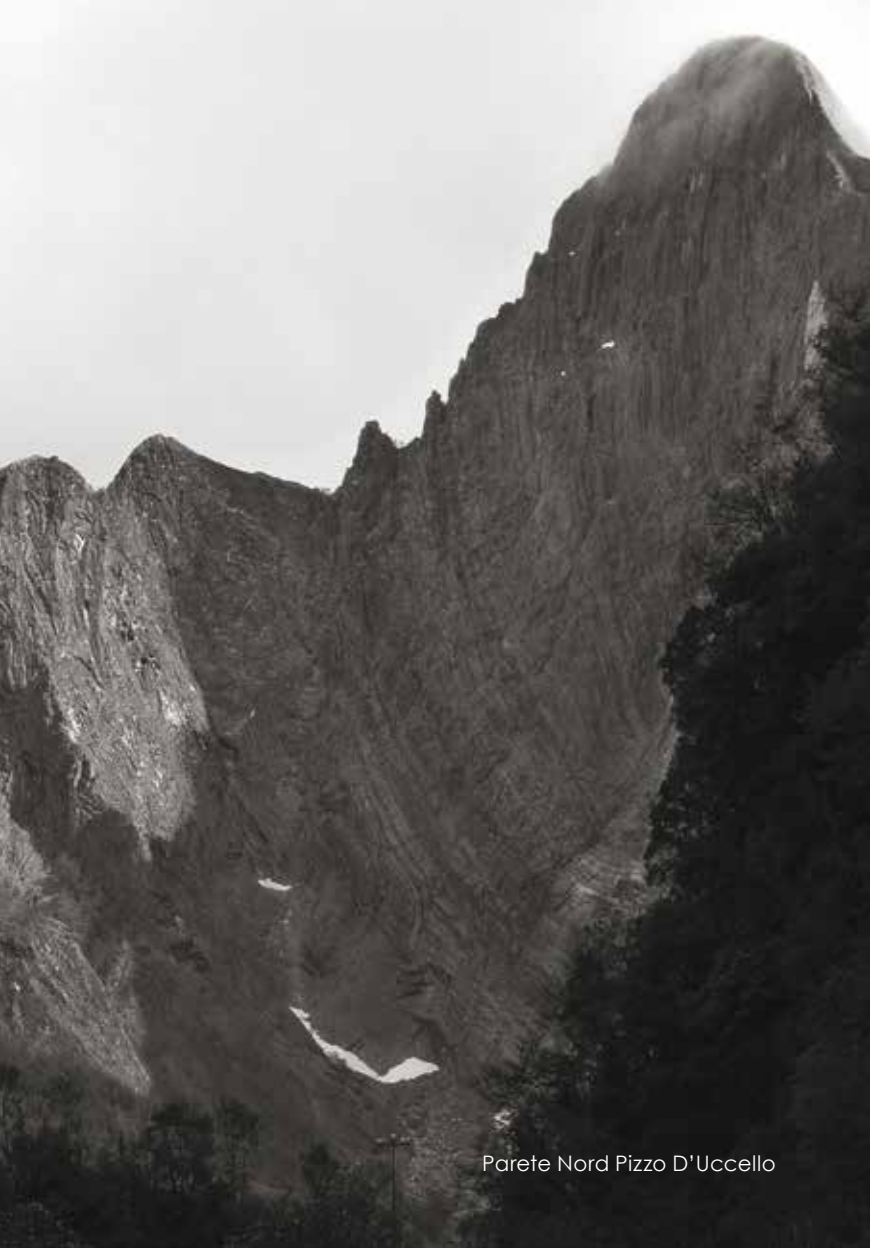
Parete Nord Pizzo D'Uccello